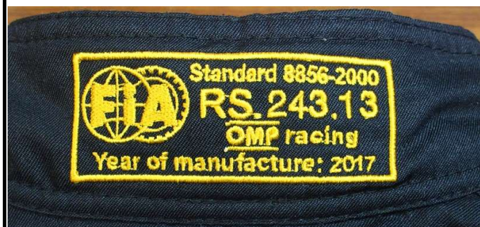
レーシングスーツの FIAラベルの写真